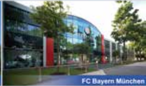
FC Bayern München