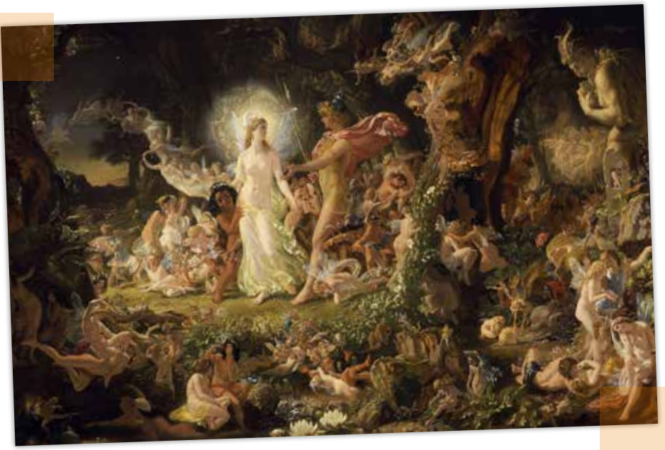
SIR JOSEPH NOEL PATON - La Querella de Oberon y Titania (National Galleries of Scotland, 1849)

Die Rahmenhandlung lässt vermuten, dass Shakespeare die komplexeste seiner frühesten Komödien fuer eine Fuerstenhochzeit schrieb, die um 1594 stattfand. In Deutschland erregte das Stueck erst in der Spätromantik Interesse: Der Dichter Ludwig Tieck inszenierte es 1843 als poetisches Märchenspiel, dem Felix Mendelson-Bartholdy seine dann beruehmt gewordene Buehnenmusik