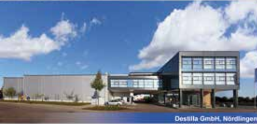
Destilla GmbH, Nördlingen