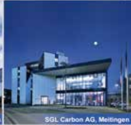
SGL Carbon AG, Meitingen